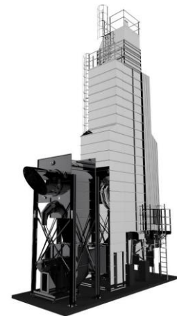
Suszarnia S 418.CS

W suszarniach S4.CS ogrzane powietrze zasysane jest przez centralny odpylacz odśrodkowy (centroseparator), który powietrze wydostające się z suszarni skutecznie oczyszcza z pyłów. Ta wersja suszarni znacznie redukuje zapylenie powietrza i hałas wokół suszarni podczas suszenia.